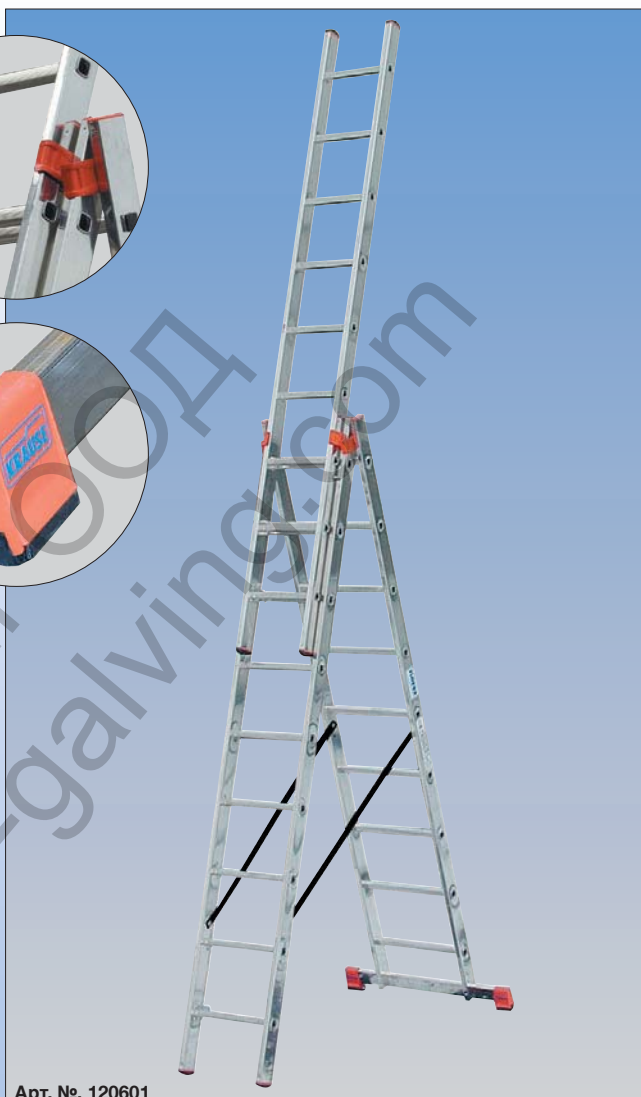
Арт. №. 120601